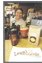
Legal Grounds Coffee Shop